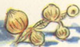
12 cebolletas pequeñas