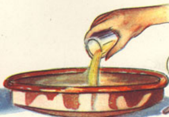
medio vasito vino blanco