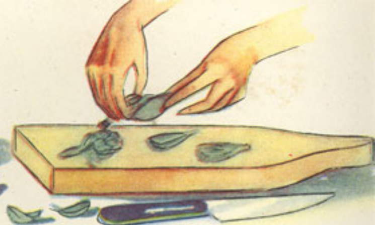
desprendimiento de las primeras hojas