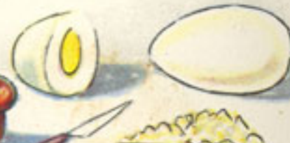
dos huevos duros