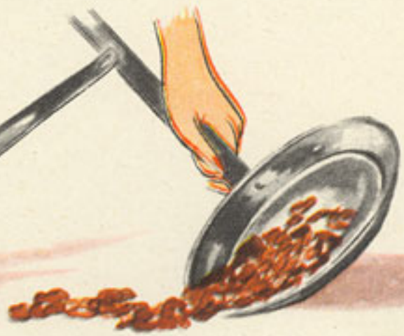
vuelco de las almendras sobre la mesa de mármol