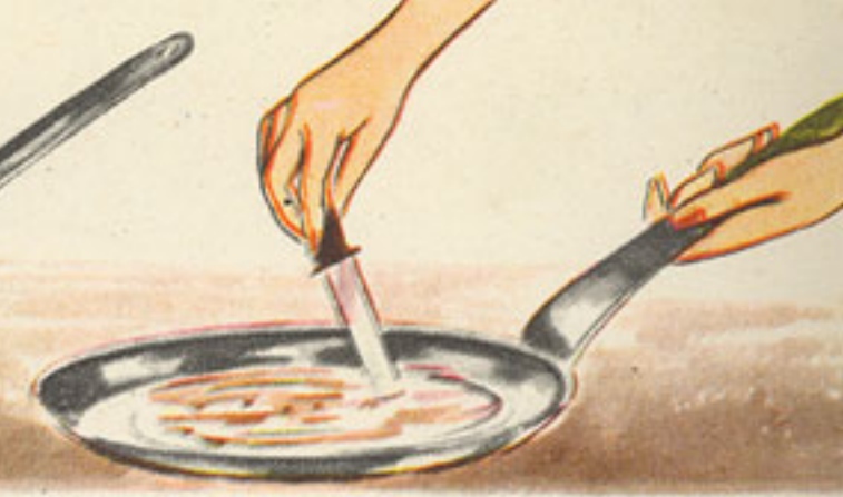
removido con el cuchillo