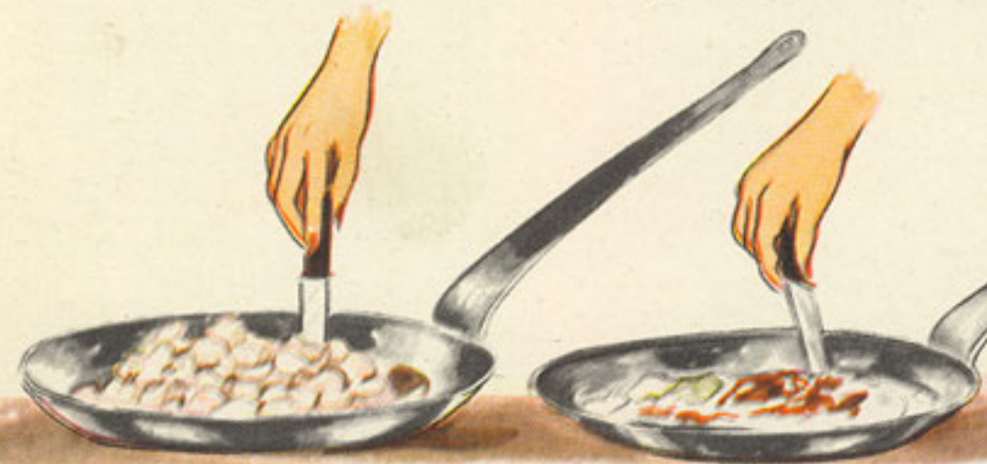
se mezcla cuando se evapora el líquido y cuando empieza a derretirse el azúcar