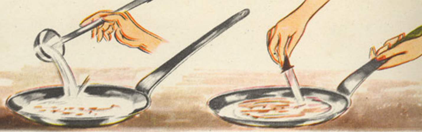
1 cacillo agua