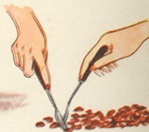
separación de las almendras