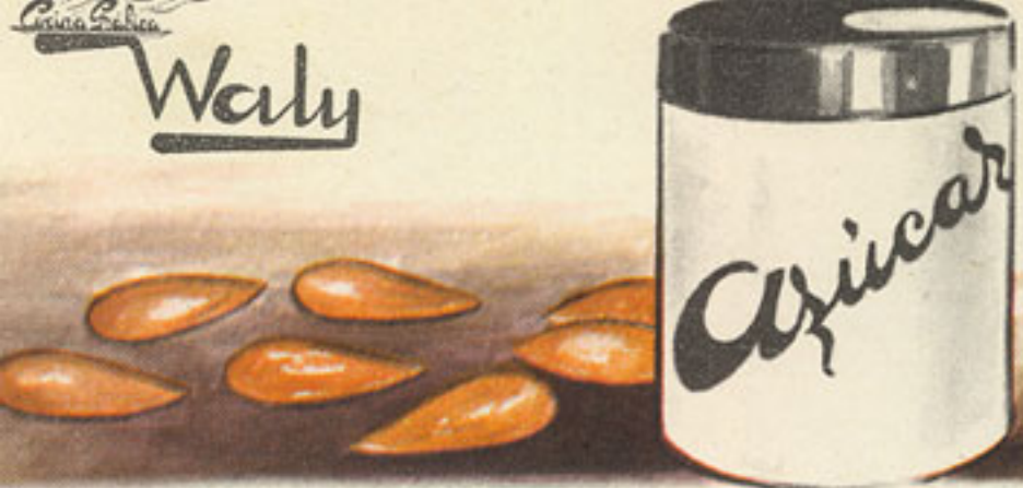
200 gramos almendras crudas 200 gramos azúcar