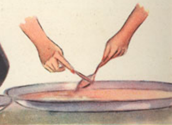
espolvoreo de canela