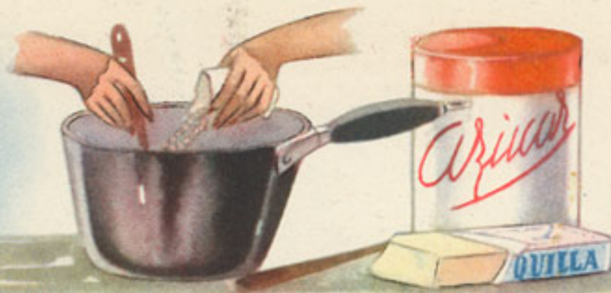
100 gramos de arroz