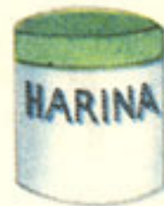
4 cucharadas harina