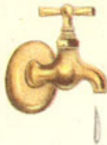
2 litros agua