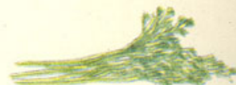
3 ramitas perejil picado