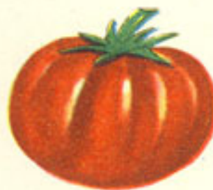
1 kilo tomate fresco