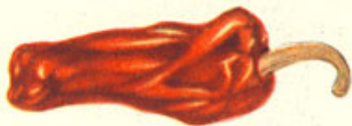
3 pimientos choriceros