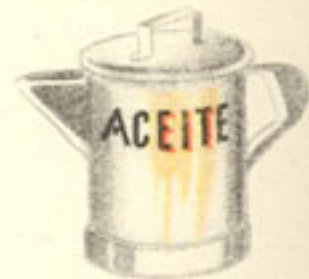
cuarto litro aceite