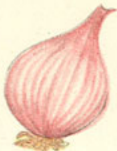
1 cebolla grande