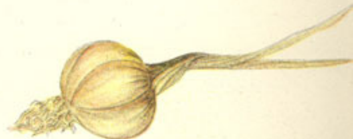
4 dientes ajo