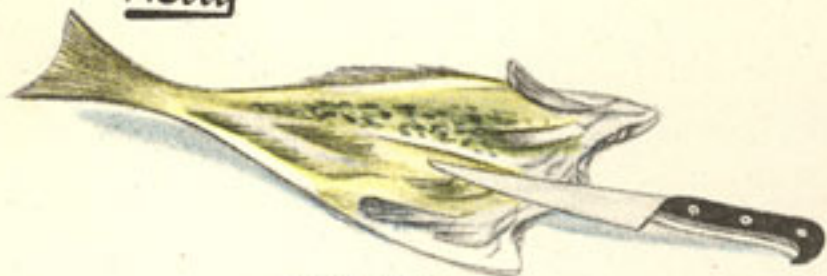
1 kilo bacalao