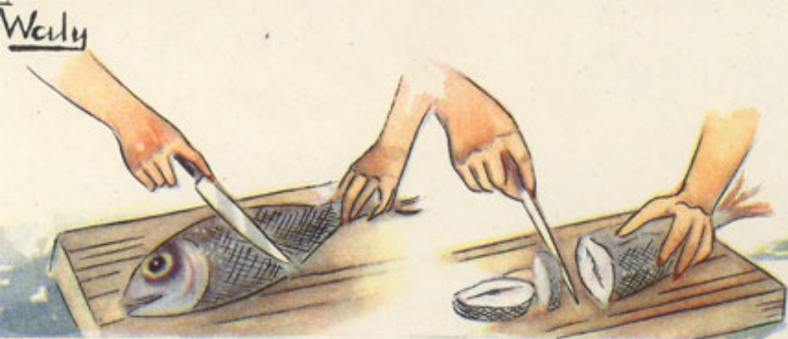
limpieza y corte del besugo