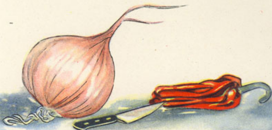
media cebolla picada