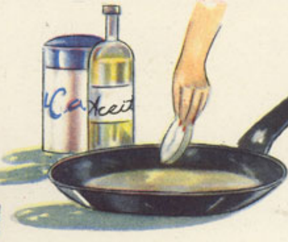
harina aceite fritura del besugo