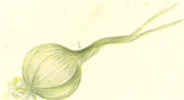
cinco dientes ajo