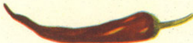
media guindilla picante