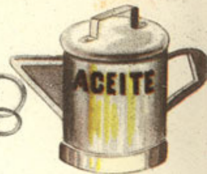
200 gramos aceite