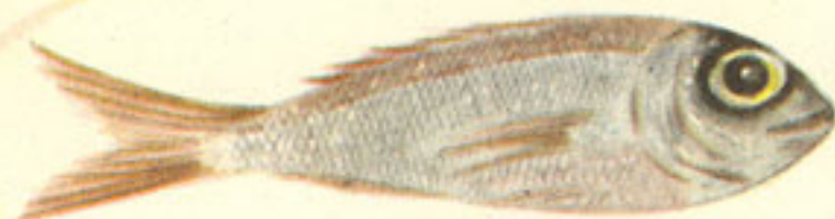
1 kilo y cuarto besugo