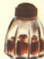
media cucharadita pimentón