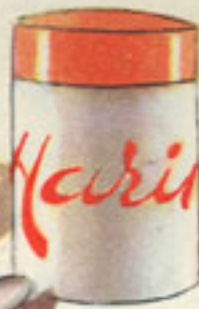
7 cucharadas harina