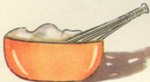
punto de nieve