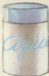
7 cucharadas azúcar