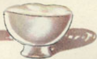
200 gms. nata cruda