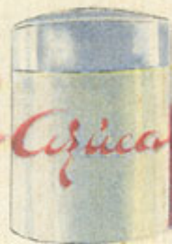
125 grs. azúcar