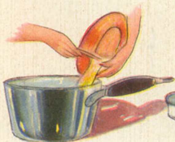
vertido del batido