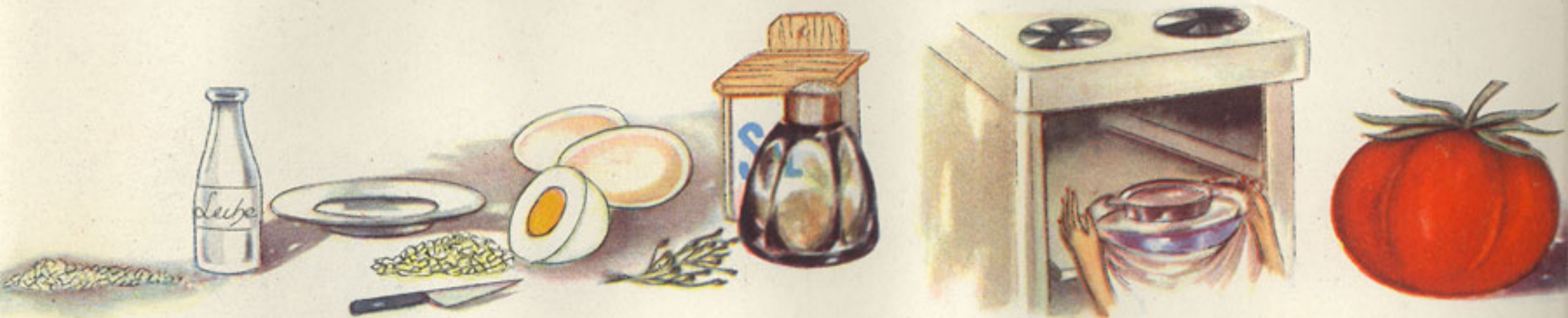
miga de pan