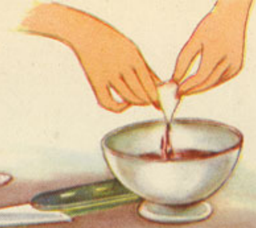
vaciado de la tinta del calamar