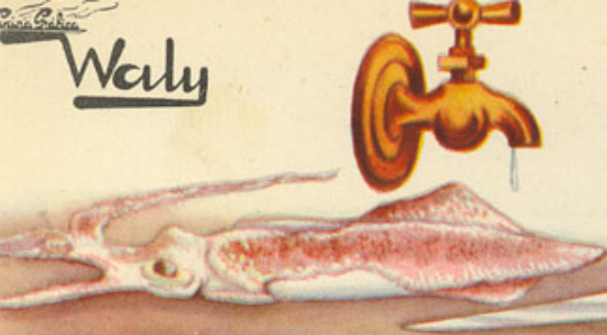
12 calamares pequeños