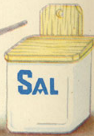
3 pellizcos sal