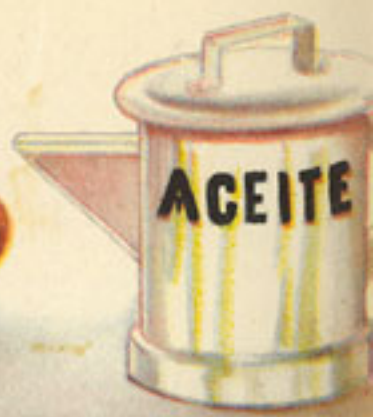
100 gramos aceite