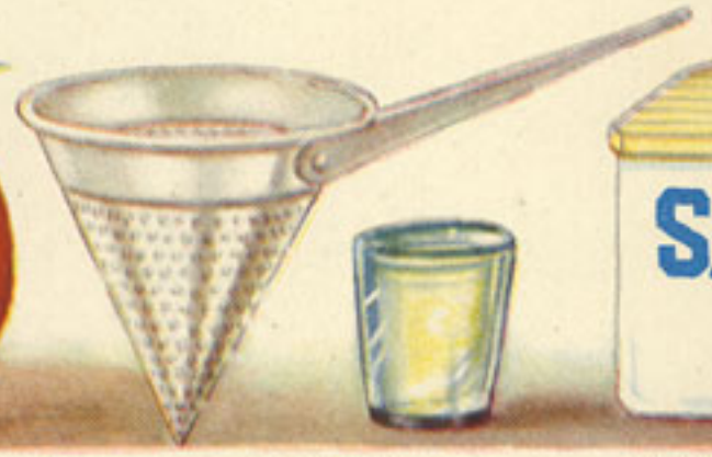
chino 1 vaso vino blanco