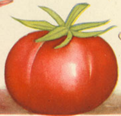
300 gramos tomate