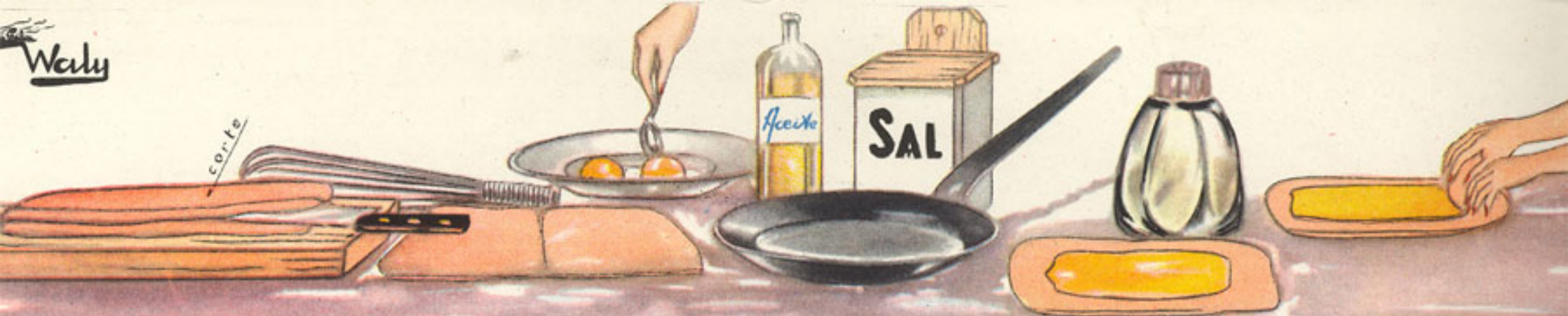
corte del filete de contra