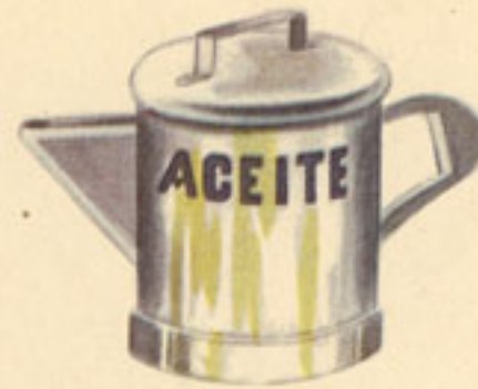
100 gramos aceite