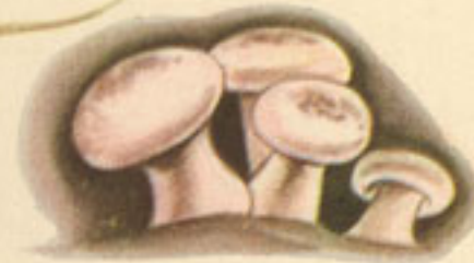
100 gramos champiñón