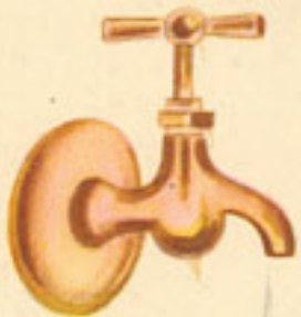
2 vasos agua