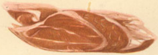
1 kilo carne