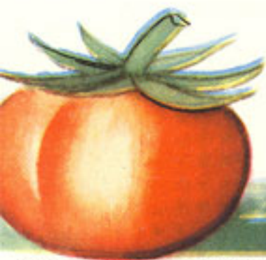
4 cucharadas puré de tomate frito