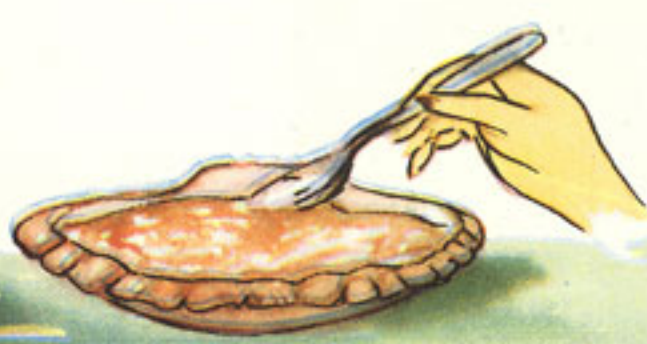
colocación de la carne en el caparazón