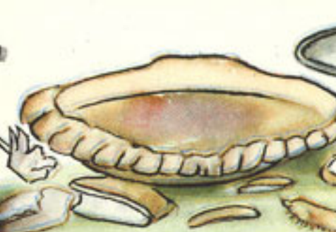
caparazón y caldo