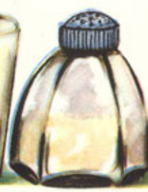
pellizco pimienta blanca