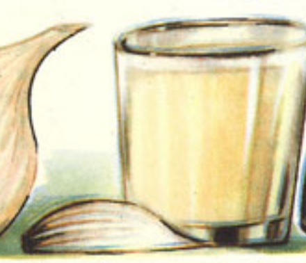
1 vaso vino blanco