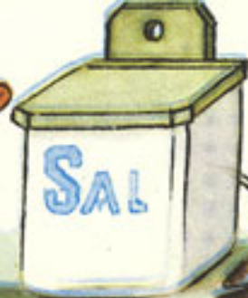
2 puñados grandes sal