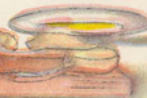
rebozado de huevo y pan rallado