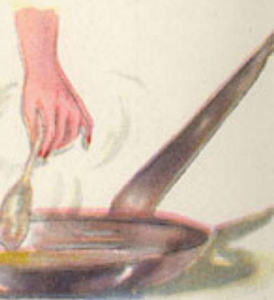
fritura de las chuletitas