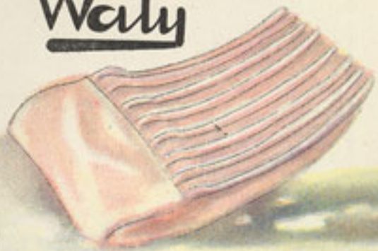
medio kilo costilla cordero