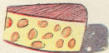
25 grs. queso gruyère rallado