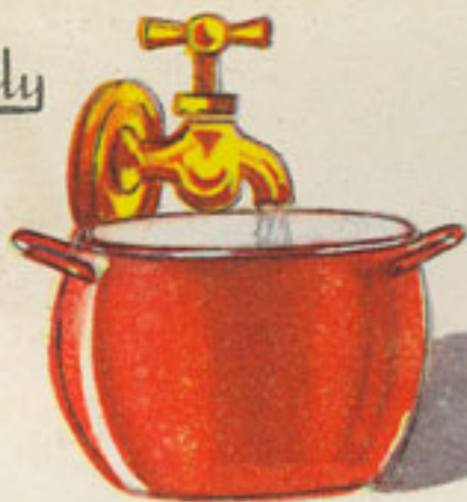
cazo 2 litros agua