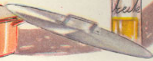
2 cucharadas aceite