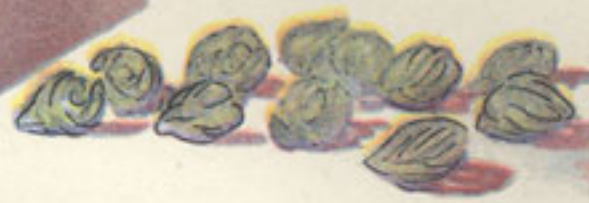
medio kilo coles de Bruselas