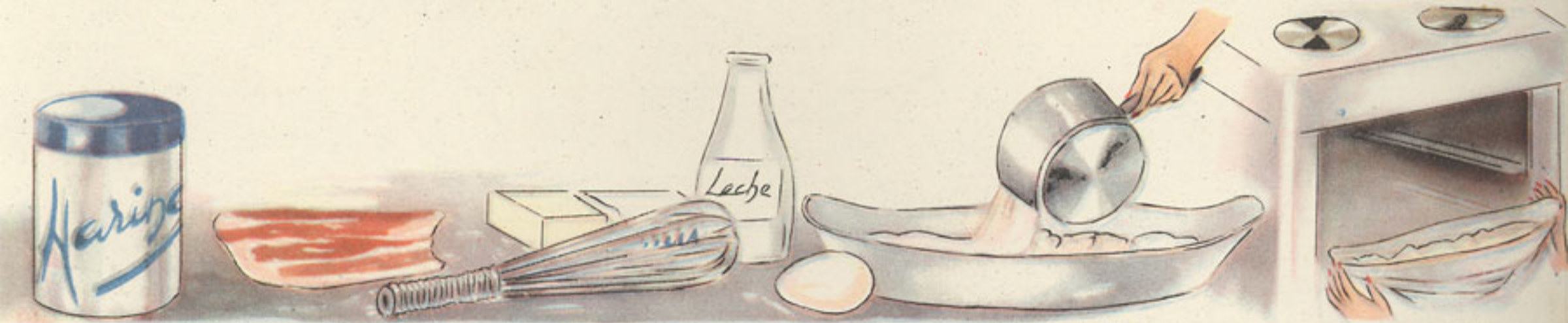
1 cucharada de harina 50 gramos jamón 30 gramos mantequilla leche huevo duro vertido de la bechamel horno