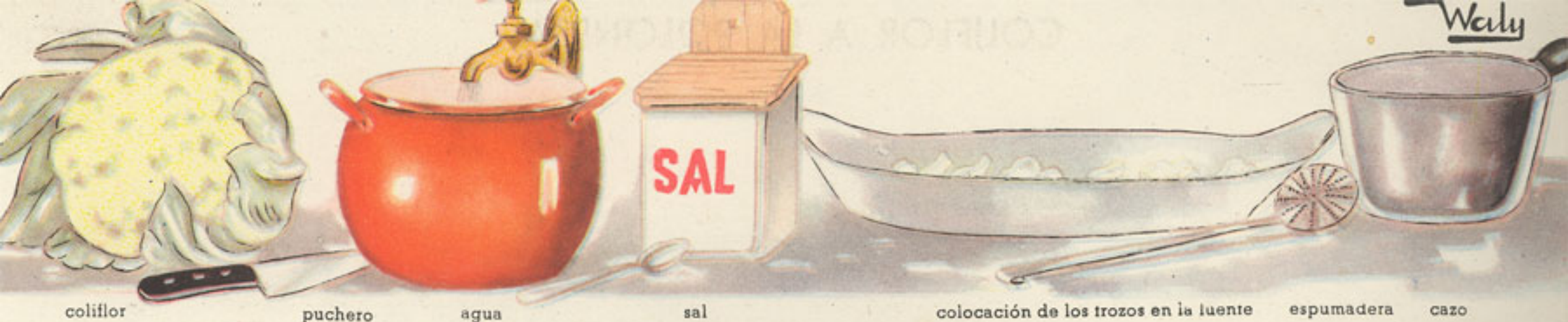
coliflor puchero agua sal colocación de los trozos en la fuente espumadera cazo