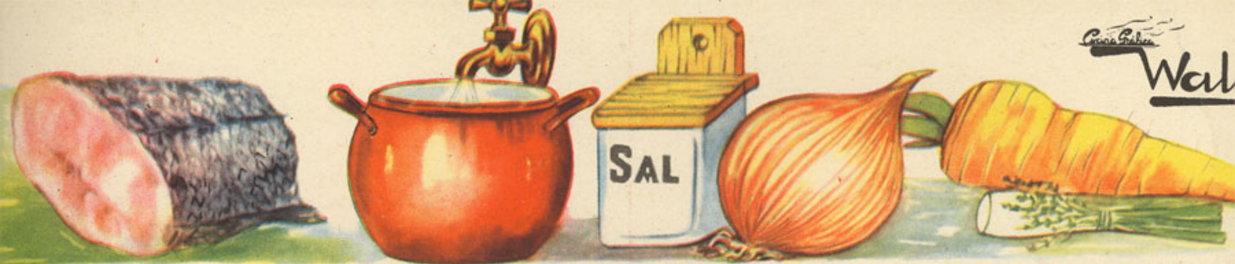
350 gramos de pescado