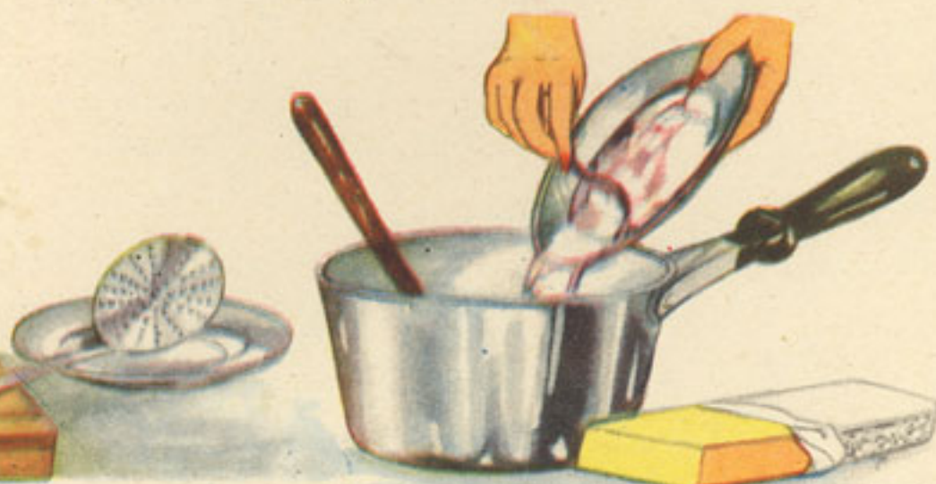
añadido del pescado a la bechamel