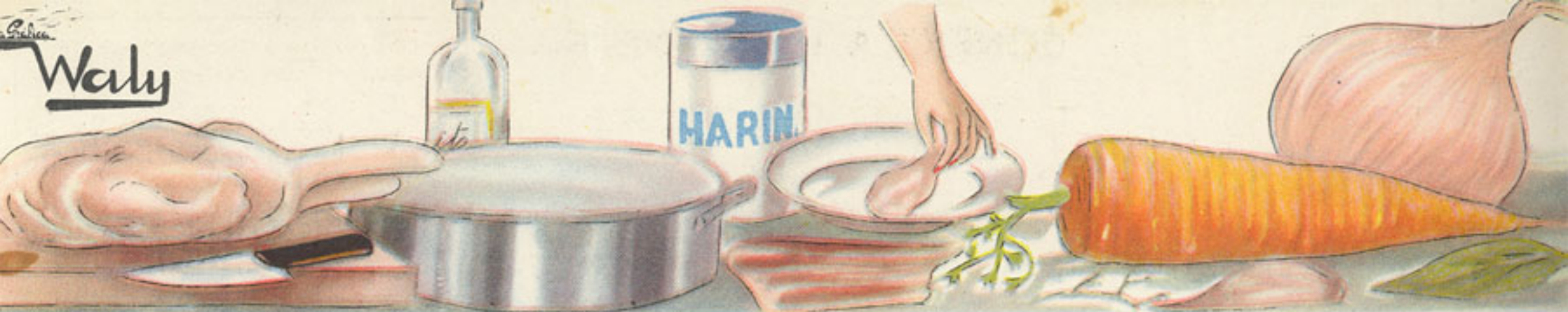
700 gramos carne de conejo