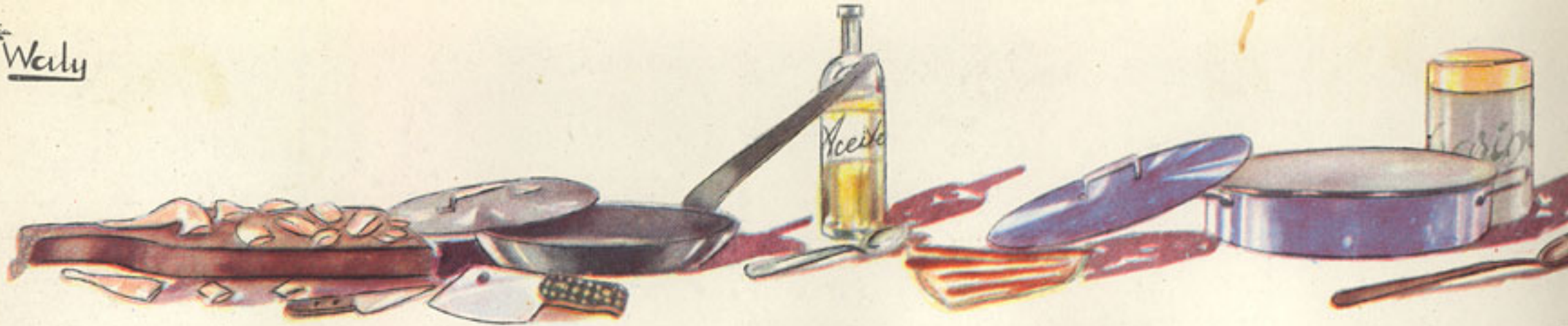
corte de conejo