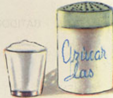
200 grs. nata