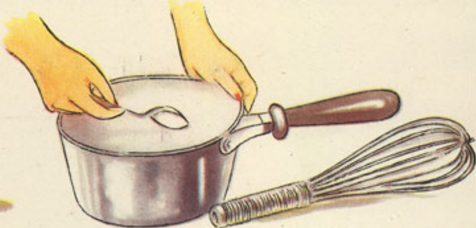
harina, media cucharada