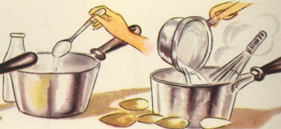
leche fría, 3 cucharadas leche hirviendo, medio litro almendras tosta