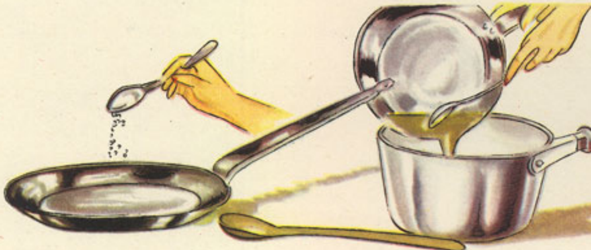
sartén azúcar derretido, 3 cucharadas