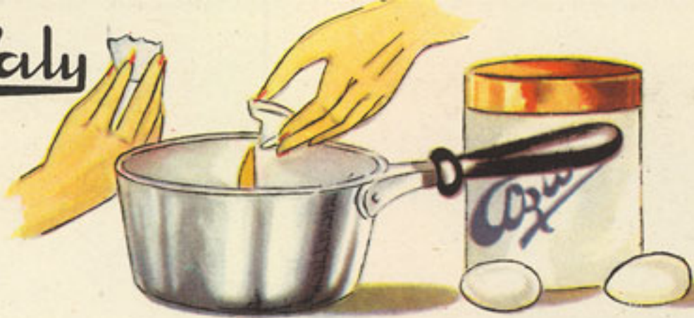
cazo 3 yemas de huevo azúcar, 4 cucharadas