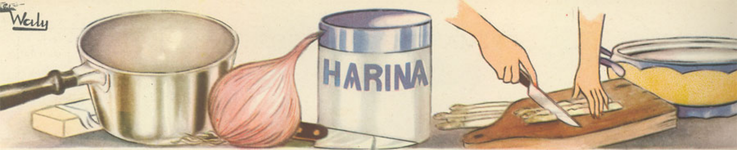
50 gramos mantequilla