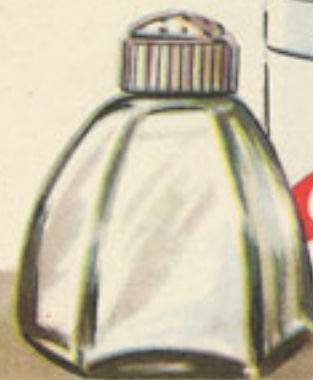
un pellizco de sal