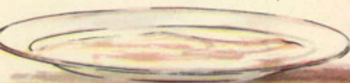
fuelle con el arroz con leche