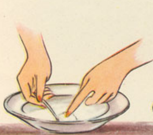
rebozado de huevo batido y pan rallado