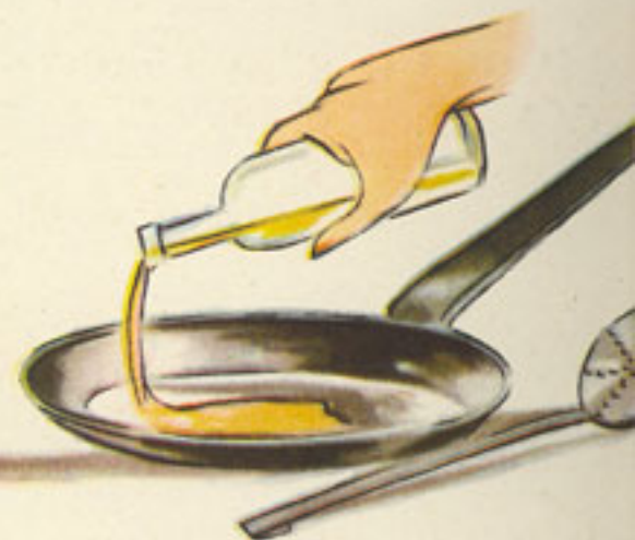
sartén y aceite para la fritura