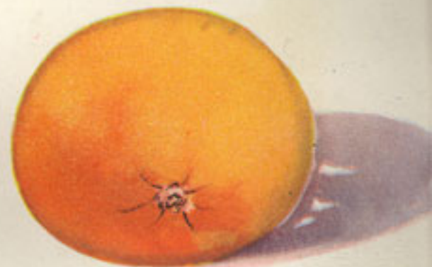
cáscara de naranja