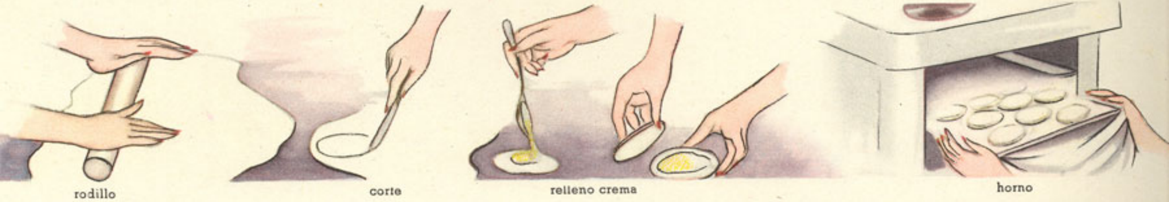
rodillo corte relleno crema horno