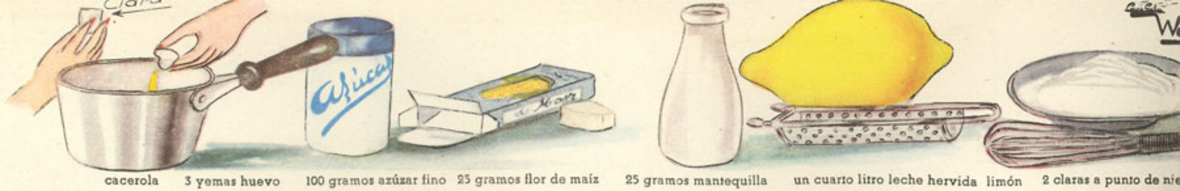
cacerola 3 yemas huevo 100 gramos azúcar fino 25 gramos flor de maíz 25 gramos mantequilla un cuarto litro leche hervida limón 2 claras a punto de nieve