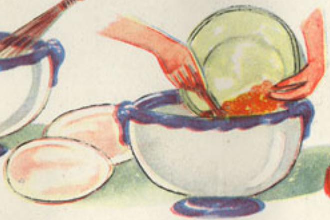
vertido del picado sobre la mayonesa