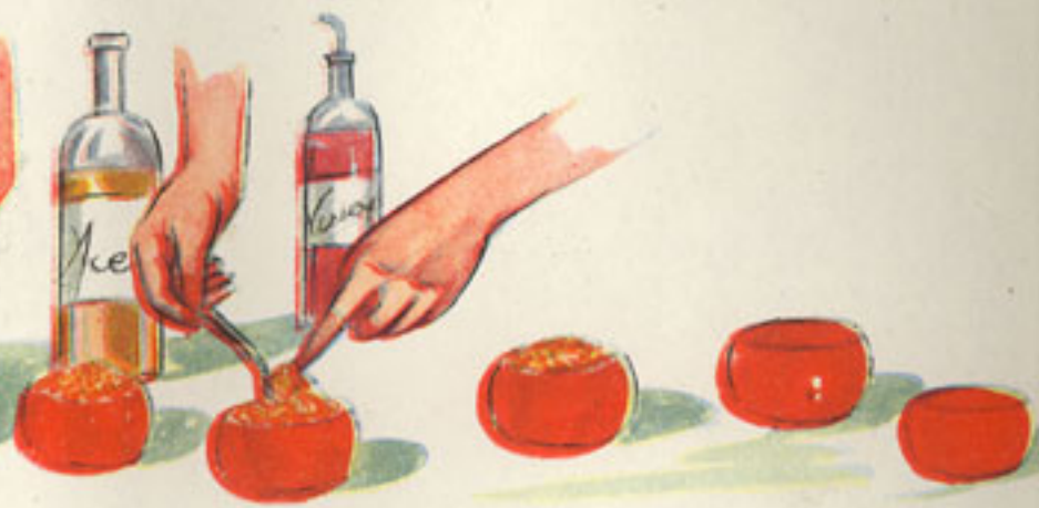
relleno de tomates