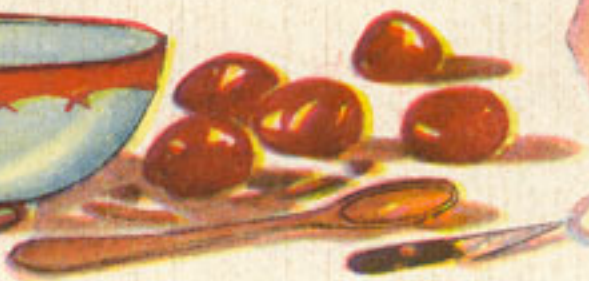
50 grs. cerezas almíbar