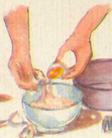
3 yemas batidas