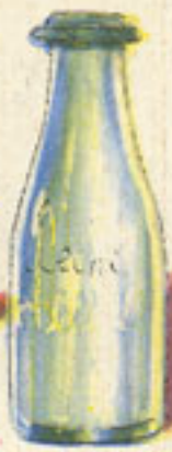
1 litro leche