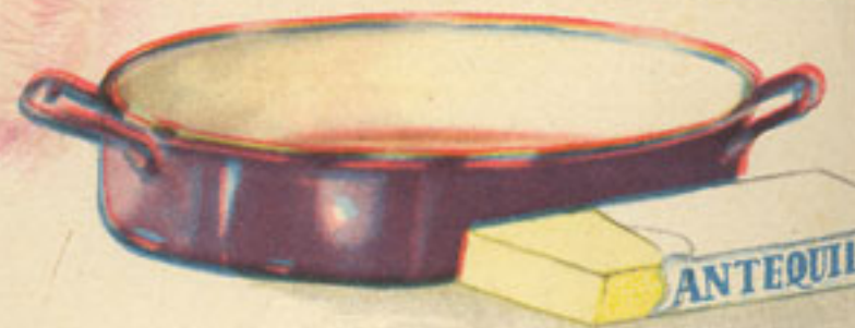
cazuela 100 gramos mantequilla