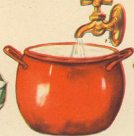
puchero 2 litros agua