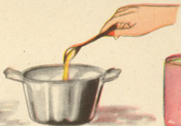
flanero 1 cucharada aceite