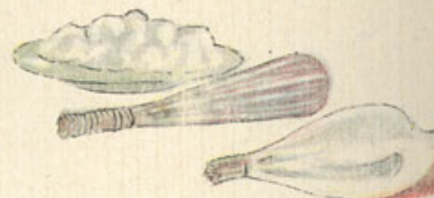
3 claras montadas a punto de nieve con 2 cucharadas azúcar