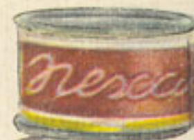
2 cucharadas Nes-café