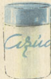
6 cucharadas azúcar