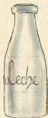
1 cucharada leche fría