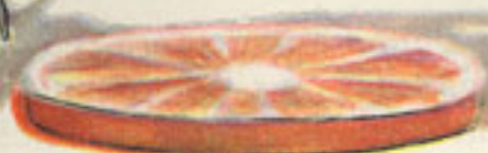
relleno del flanero