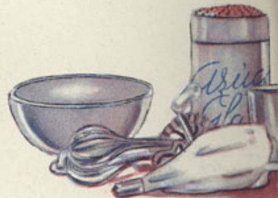
batidor azúcar glas nata mangu