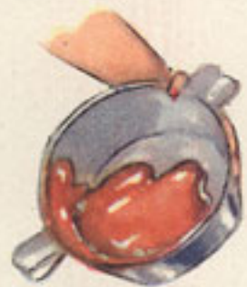
50 grs. azúcar derretido