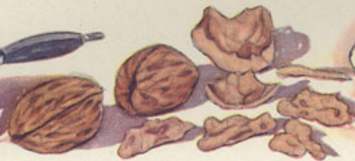
100 grs. nueces