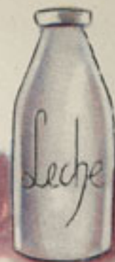
medio litro leche