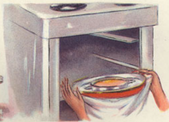
baño maría horno