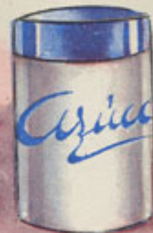
150 grs. azúcar