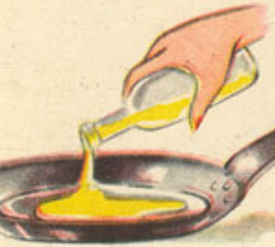
50 gramos aceite