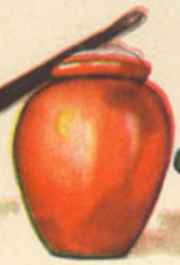
50 gramos manteca cerdo