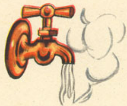
medio litro agua hervida