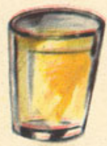
1 vaso vino blanco