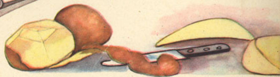
medio kilo patatas