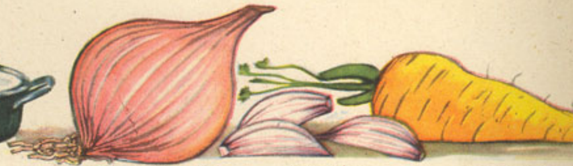
150 gramos cebolla