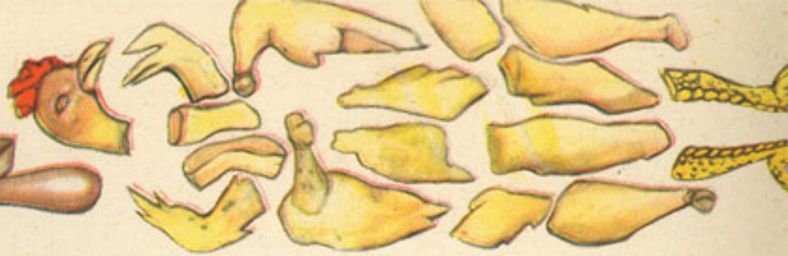
manera de cortar la gallina