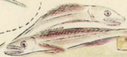
pescadilla, medio kilo