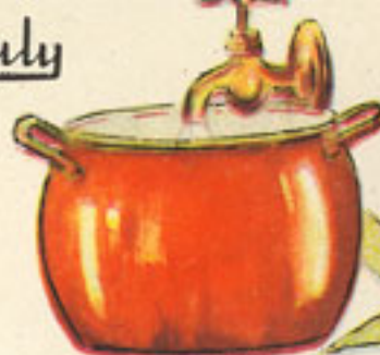
agua, 2 litros