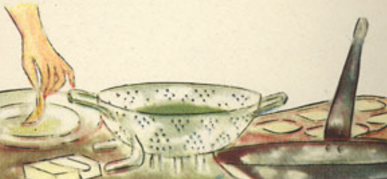
mantequilla, 25 gramos escurridor sartén