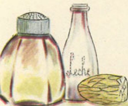
pimienta nuez moscada