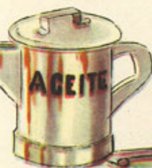
aceite, cuarto de litro