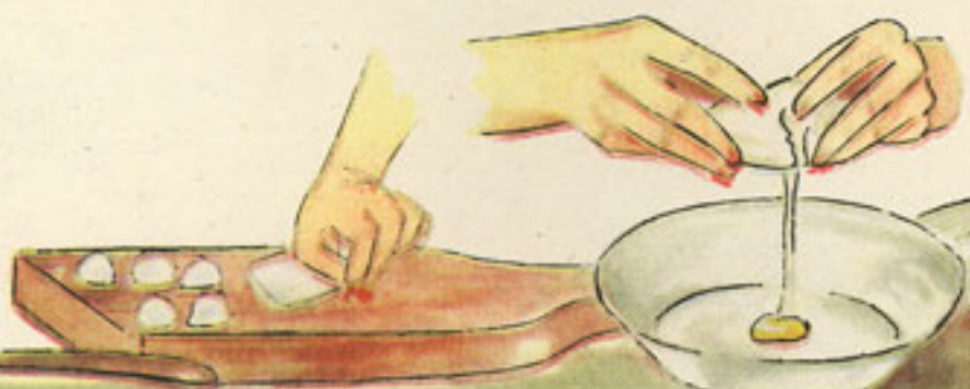
porciones pescadilla rebozado en huevo y pan rallado