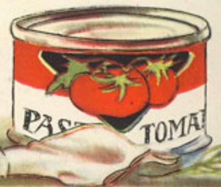
manguera puré de tomate perejil