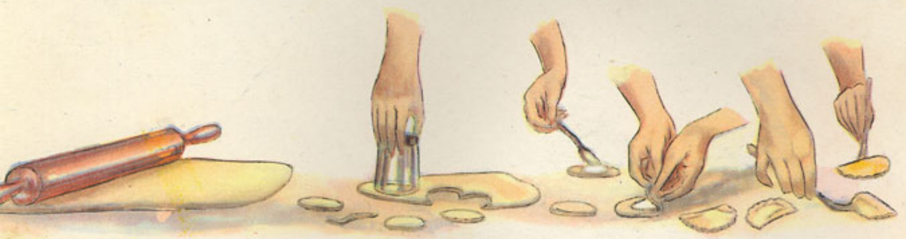
rodillo recorte de la pasta relleno y acabado de las glorias