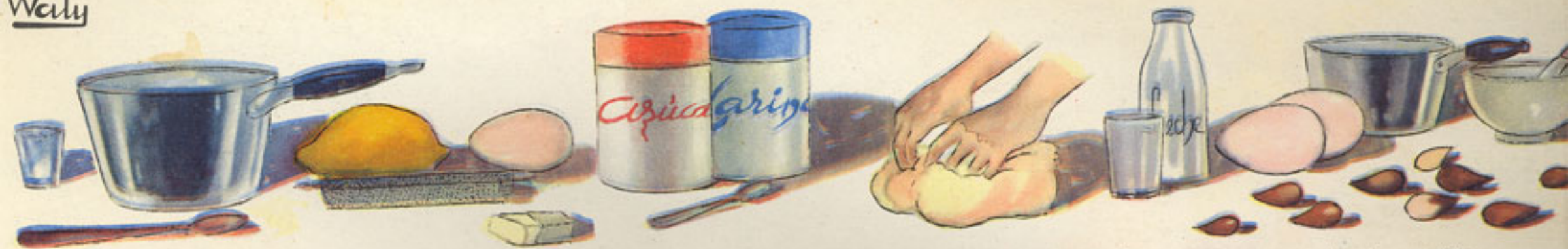
cazabo aguardiente corteza limón rallado huevo mantequilla azúcar harina manipulación de la mezcla leche almendras molidas