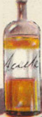
2 cucharadas aceite