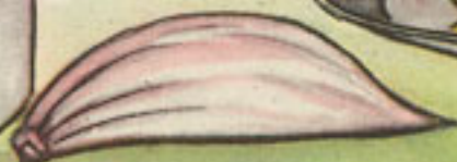
6 dientes ajo