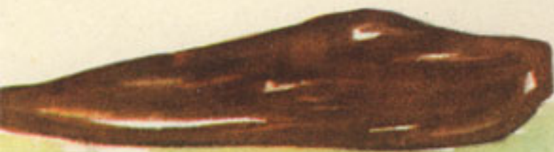
1 kilo hígado ternera