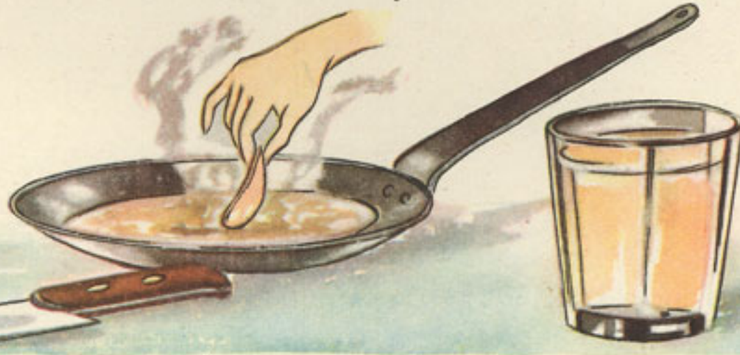
fritura del hígado