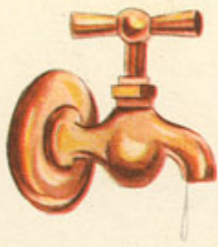
tres cuartos litro agua