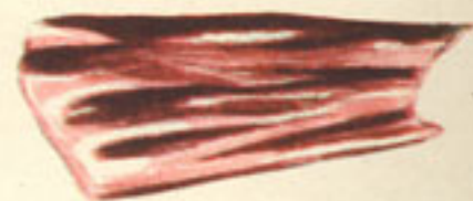
80 gramos jamón