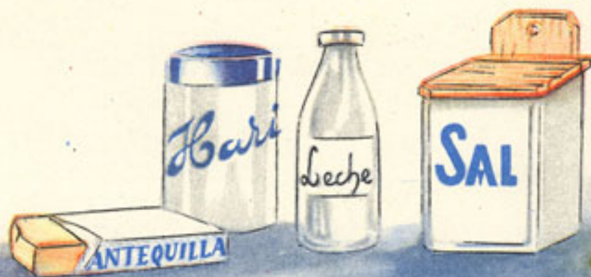
20 grs. mantequilla