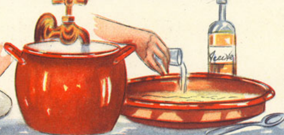
remojo de vispera