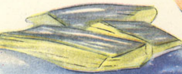
250 grs. bacalao