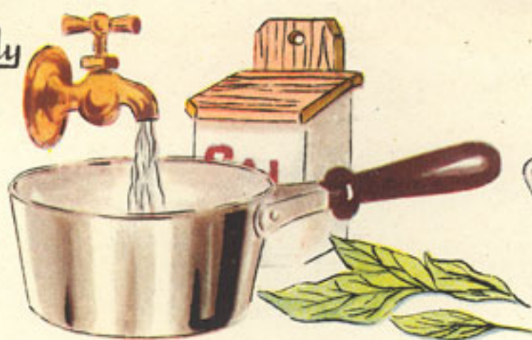
cazo agua, 3 litros sal, 2 cucharadas