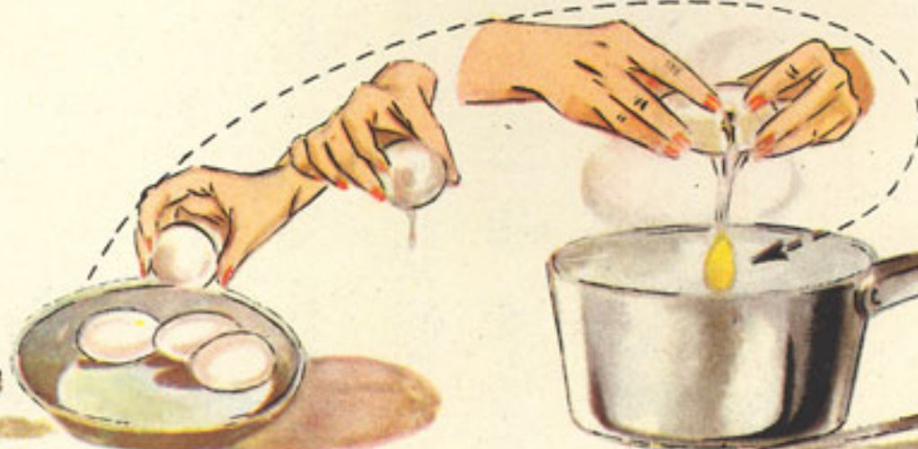
escalfado de los huevos