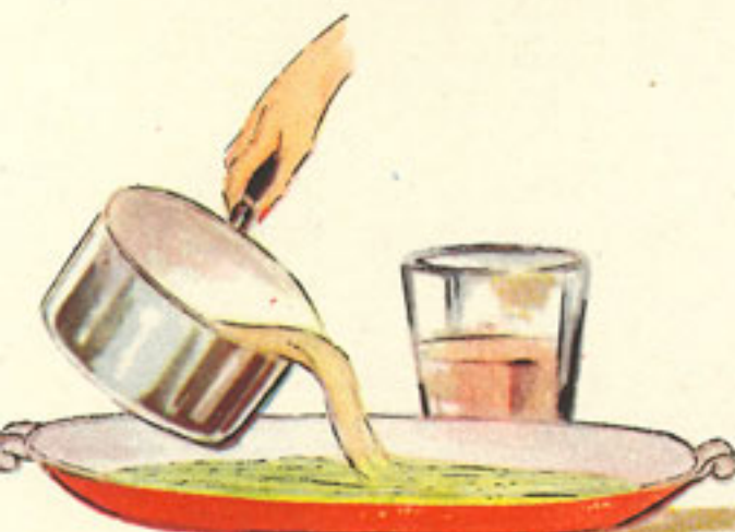
puré de espinacas vinagre, medio vasito