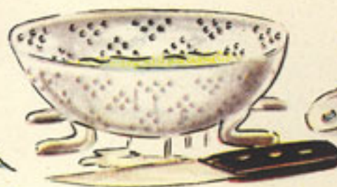
espinacas, 1 kilo