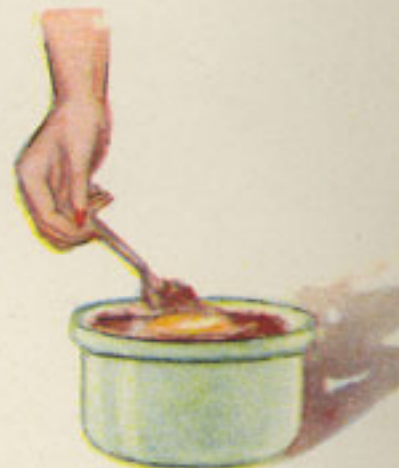
relleno del picado