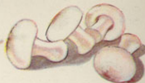
100 gramos champiñones