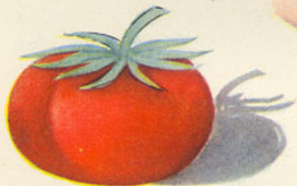
1 cucharada salsa tomate