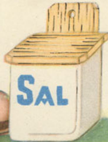
1 cucharilla sal