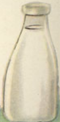
un cuarto litro leche hervida