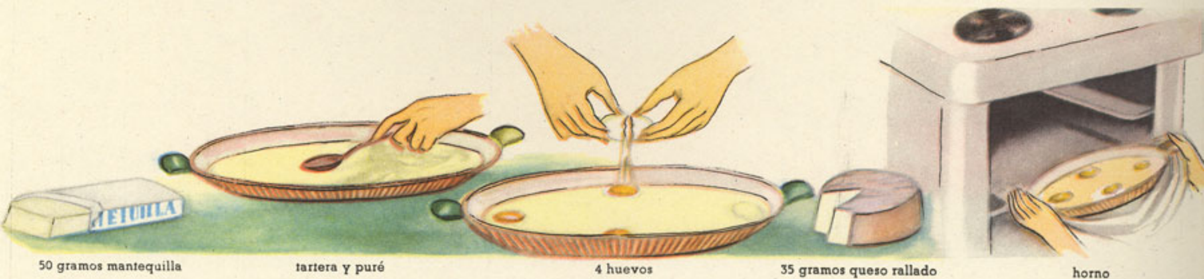
50 gramos mantequilla