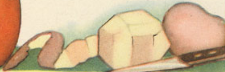
medio kilo patatas