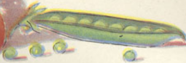
100 grs. guisantes