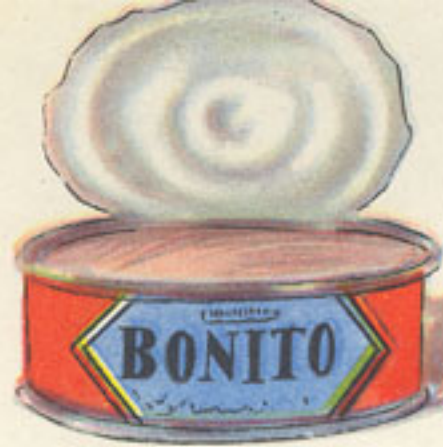
50 grs bonito