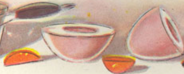
4 huevos duros