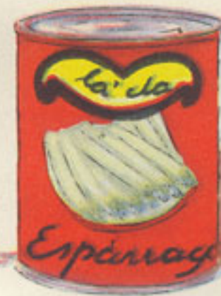
lata de espárragos