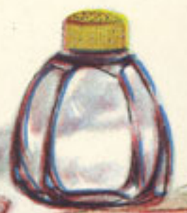
jamón en dulce pimienta blanca