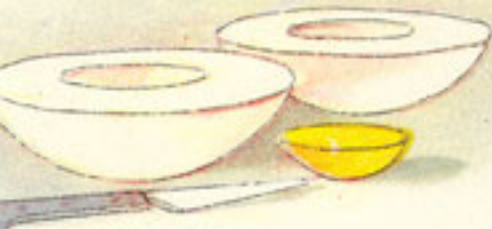
4 huevos duros