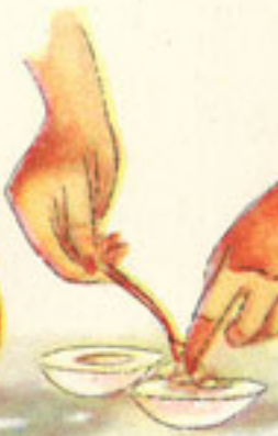
relleno del picado