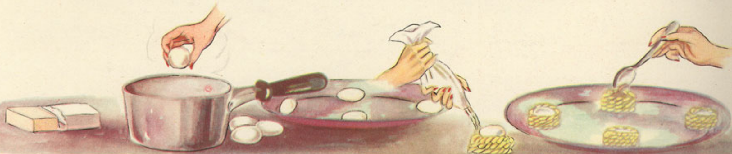
25 gramos mantequilla