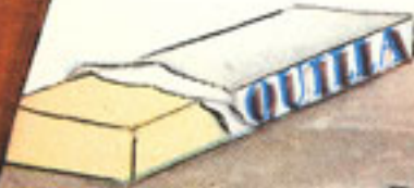
1 cucharada mantequilla