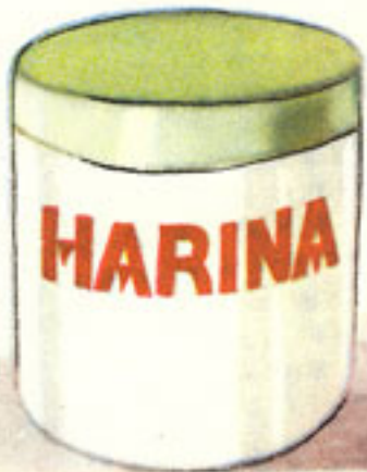
1 cucharada rasa harina