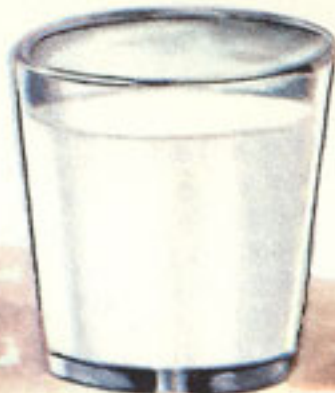
1 vaso leche