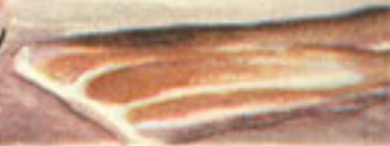
50 gramos jamón