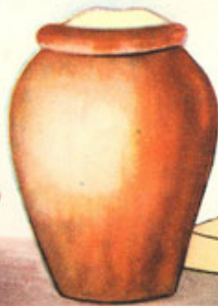
1 cucharada manteca de cerdo