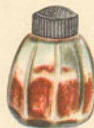
cayena un pellizco