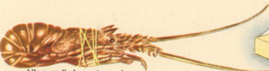
kilo y medio langosta en vivo