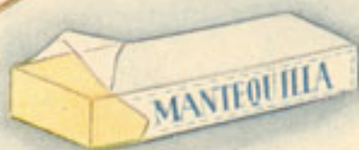
mantequilla 50 gramos