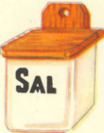
media cucharilla sal