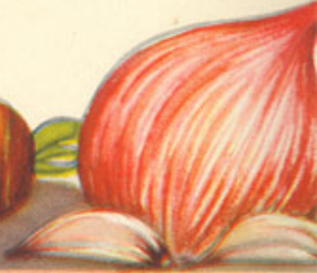
1 ramita perejil media cebolla 3 dientes