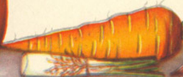
2 zanahorias 2 puerros