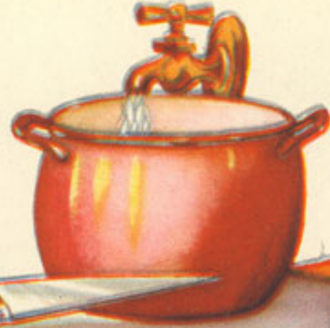
tabla y cuchillo puchero 2 litros agua