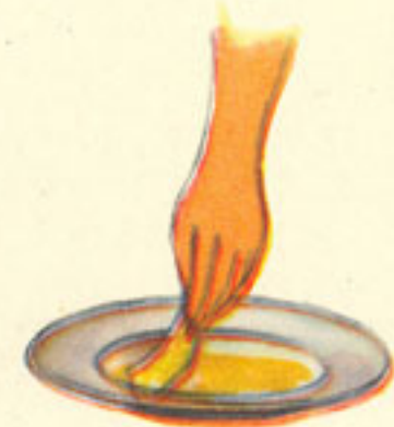
rebozado huevo sartén