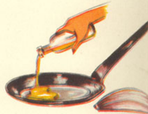
200 gramos aceite y 1 diente ajo