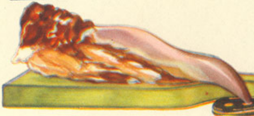
lengua de ternera