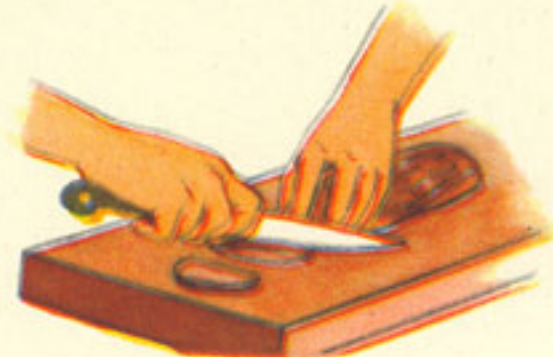
corte de la lengua