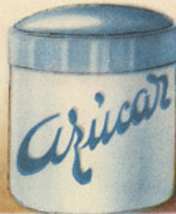
125 gramos azúcar