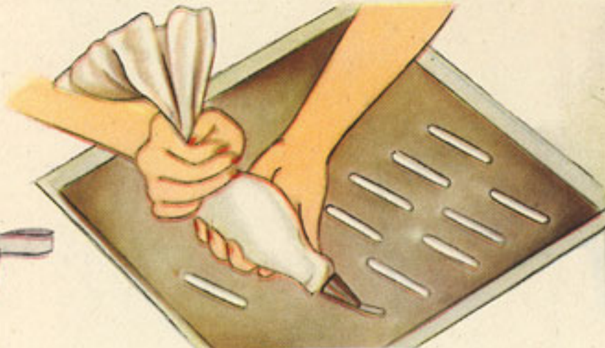
manipulación sobre la chapa