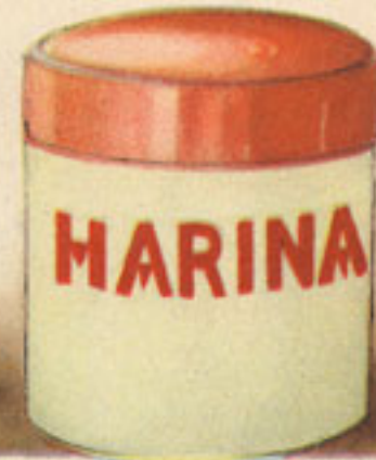
125 gramos harina