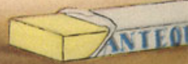
125 gramos mantequilla