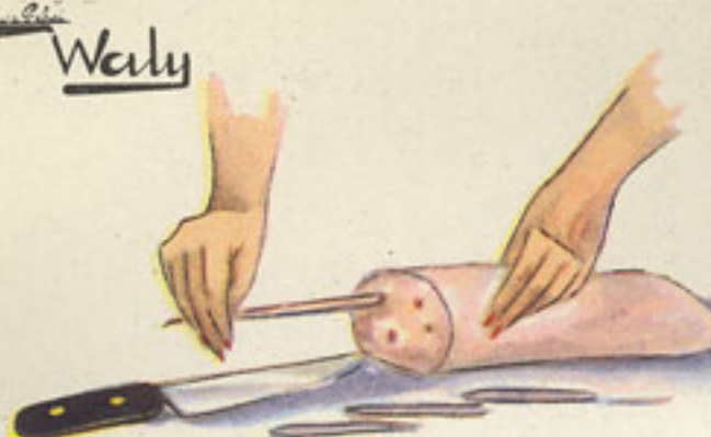
medio kilo de lomo