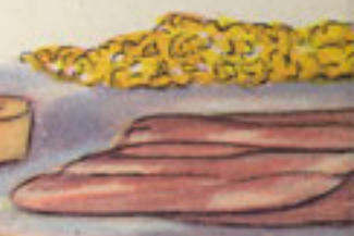
jamón en dulce .huevo hi